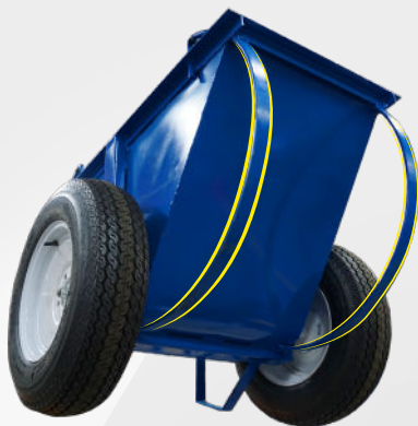
BASE DE VUELCO