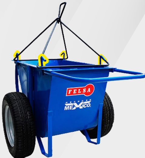
BASE DE SOPORTE ESTACIONARIO

Fácil elevación mediante JUEGO DE TRIÁNGULOS Y 4 PUNTOS DE SUJECIÓN